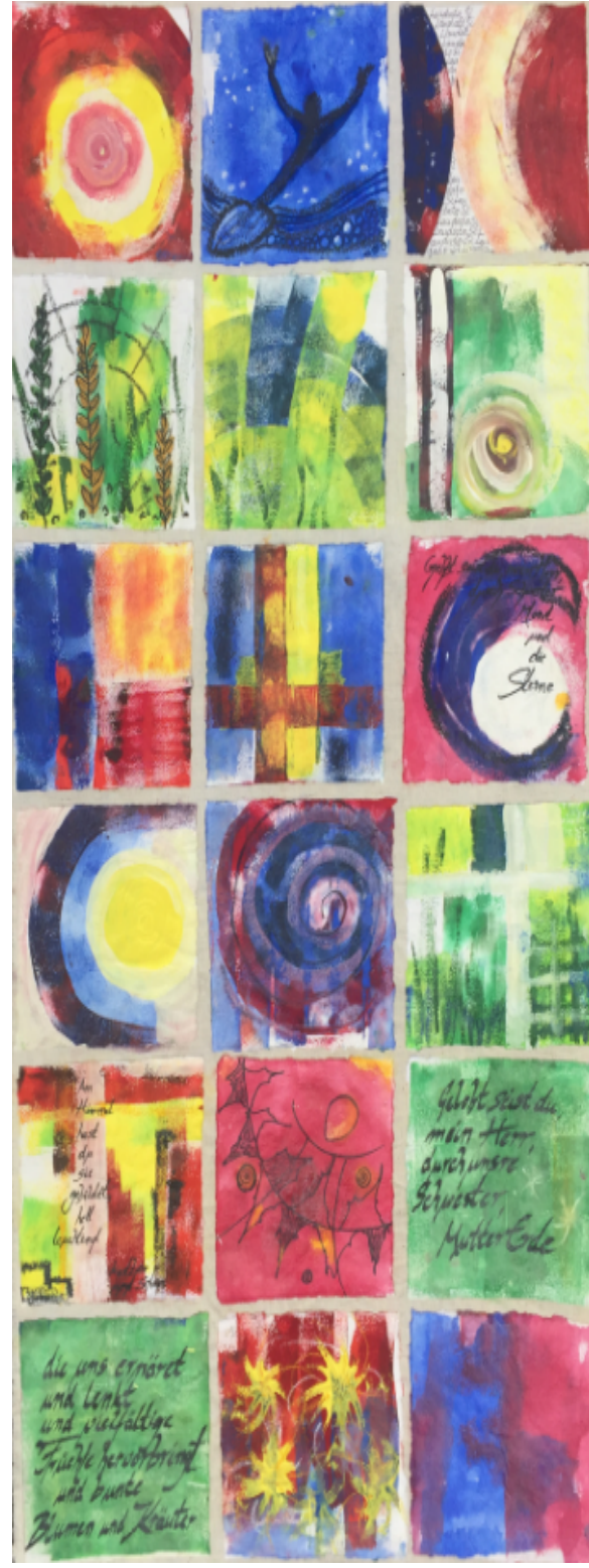
Laudato Si - ein deutsch peruanisches Kunstprojekt am Samstag, 10. September 2016